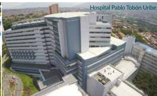
Hospital Pablo Tobón Uribe